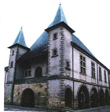
Les halles : centre de la vie marchande, ce bâtiment fut construit sur décision du duc Henry de Lorraine (23 juin 1614)