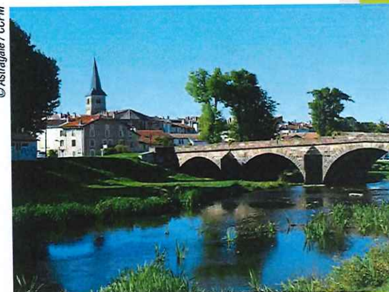
Vue romantique de Mirecourt