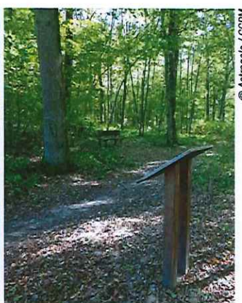
La forêt, sujet de découvertes...