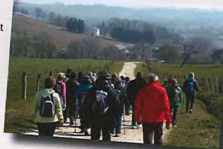
Randonneurs sur les hauts d'Ambacourt

Hôtels, gîtes, chambres d'hôtes, etc. : renseignements à l'Office du tourisme de Mirecourt.