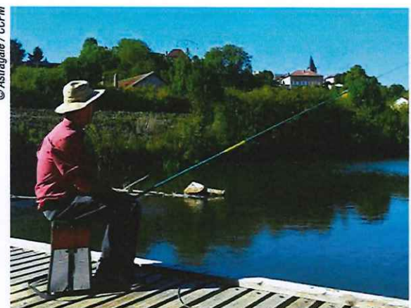
Pêche sur le Madon

À DÉCOUVRIR EN CHEMIN • points de vue • rives du Madon