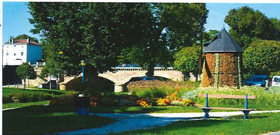
Paradis de verdure le long du Madon

FRV18-2 - Le nom RandoFiche® est une marque déposée, nul ne peut l'utiliser sans l'autorisation de la Fédération française de la randonnée pédestre. © FFRandonnée 2016. Réédition des textes : Comcom du Pays de Mirecourt. Entretien du sentier : L'Astragale / FFRandonnée.