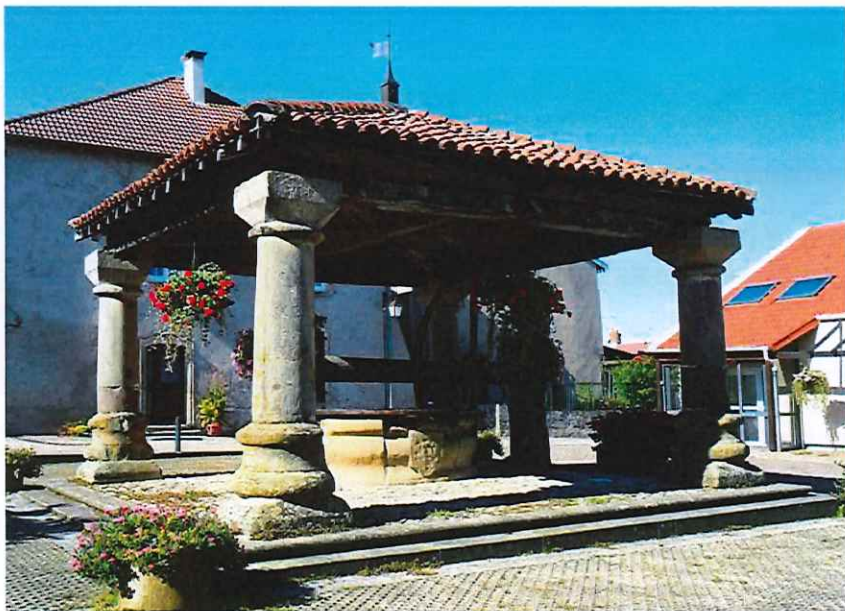
Vieux puits du XII e siècle, à Poussay

pauvres que riches ». La Bienheureuse Alix Le Clerc et ses compagnes enseignaient gratuitement aux jeunes filles les principes d'une bonne éducation. De nombreux vestiges de son histoire, témoignent de ce riche passé. Vous pourrez admirer la mairie, ancienne maison de chanoinesse, la ruelle Montaigne, le puits (monument classé historique remontant au XI e siècle avec son ensemble urbain authentique, la fontaine ronde qui se trouve devant une maison canoniale ainsi que l'arbre de Sainte-Menne, route de Puzieux, qui a été replanté suite à la tempête de 1999.