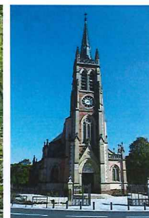
Basilique Saint-Pierre-Fourier, à Mattaincourt