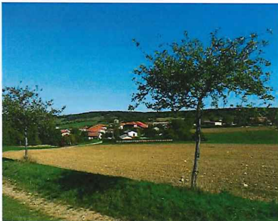
Point de vue sur Mazirot