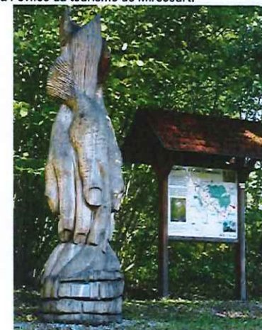
Les statues en bois agrémentent le parcours

Pensez à réserver ! Hôtels, gîtes, chambres d'hôtes, etc. : renseignements à l'Office du tourisme de Mirecourt.